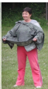
Cachovská hra "KARPOŠ" zaujala všetkých ...