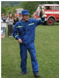
Výťažný pohár v rukách veliteľa DHZ

Súťaž Dobrovoľných hasičských zborov sa konala 20. júna 2009 v obci Poluvsie pri Pravenci.