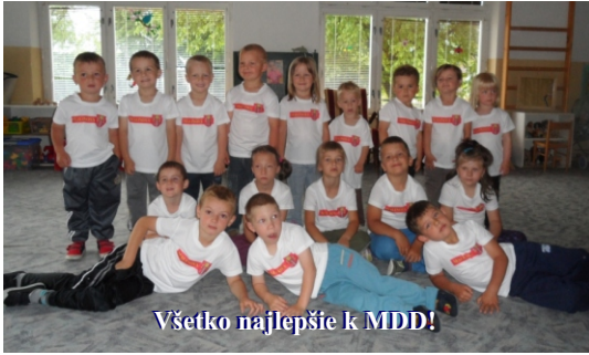
Všetko nejlepší k MDD!

V Materskej škole v Malinovej sa deti tešili zo sviatku MDD hneď z rána. Deti dostali sladkosti, tričká s erbom obce Malinová a k tomu mali výlet do ZOO v Bojniciach.