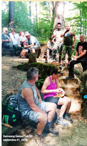
Samsung Galaxy Tab A9 septembra 01, 2024

Nová tradícia, Deň obce Malinová, má cieľ v prvom rade dôstojne si v obci pripomenúť výročie SNP a zároveň oslavy spojiť s podujatím pre všetkých občanov. Tentokrát sme si takto pripomenuli, okružle, 80. výročie Povstania. Prologom bol v piatok 30. augusta tradičný pietny akt kladenia vencov padlých našich občanov v boji proti fašizmu. Aby sme si na nich spomenuli, vedľa pamätníka boli tabuľky s ich menami a osobnými údajmi a tiež ich portréty. Ich pamiatku si uctili predstavitelia obce, aj zástupcovia spoločenských organizácií. Po pietnom akte sa ešte uskutočnil slávnostný zápis do pamätnej knihy obce.