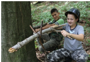
Chlapci neodolali hre na vojakov...