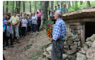
Minúta ticha na počesť padlým pri bunkri ...

Prvé zastavenie v príjemnom chládku lesa ... o hodinu občerstvenie pri studničke ... a konečne na mieste pri bunkri Turistického podujatia pri príležitosti osláv SNP sa zúčastnilo 43 účastníkov.