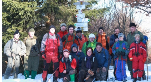
Výstup na Maguru 30.12.2012