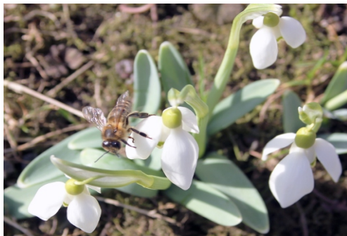
Prvé snežienky a včela v záhrade J. Minicha.