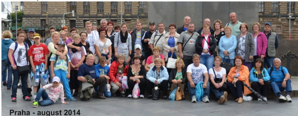
Praha - august 2014