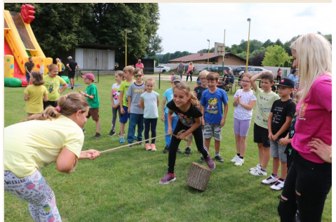
Športový deň na začiatku prázdnin je plný súťaží a zábavy. Tak tomu bolo aj minulý rok.

júl - august - prázdninové letné kino - každý piatok večer areál pred Partizánskym domom