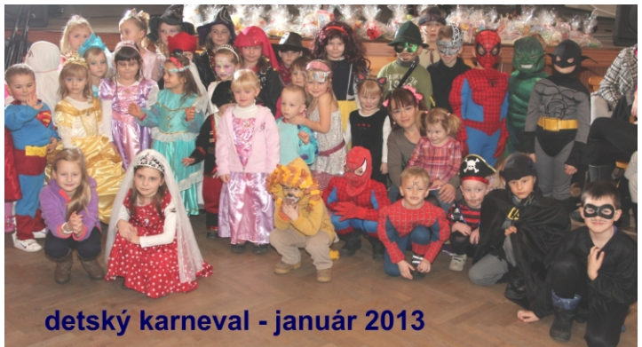
detský karneval - január 2013