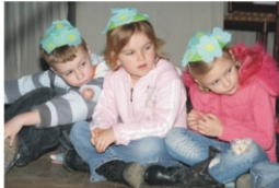
- fotografie z podujatia

Deti v klube mládeže Junior pripravovali po celý mesiac pre všetky ženy srdiečka - ozdobu k jarnému kvietku v kvetináči. Pripravili ich 120 a všetky po kultúrnom programe rozdali.