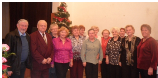
Foto: Výbor klubu dôchodcov a hostia z Kľačna

Pri príprave podujatia celá práca na členoch výboru, za čo im patrí poďakovanie. So želaním pokojného prežitia vianočných sviatkov, piesňou Tichá noc a s medovínikom od firmy MEDEX Malinová sa podujatie podvečer skončilo a všetci sa rozišli domov k svojim blízkym.