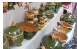
*Z podujatia a zájazdu M.Luprichova