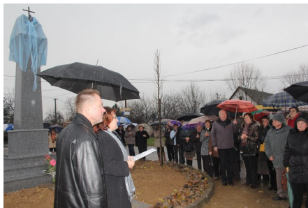
Odhalenie obnoveného stĺpa sprevádzal dážď.

Starostka spomína aj ďalšie podrobnosti ako nebolo ľahké presvedčiť vtedajších poslancov, aby dali súhlas na opätovné osadenie súsošia v centre obce. Súhlasili veľmi ťažko, ba priam s podmienkou, že to nebude obec nič stáť. Až informácia z bádania o tom, že u nás zahynulo počas epidémie mnoho detí, ich zlomila. Pôvodné súsošie veriaci schovávali od zničenia stĺpa v kostole. Nikto, až na pár ľudí, v dedine nevedel, kde sa nachádza.