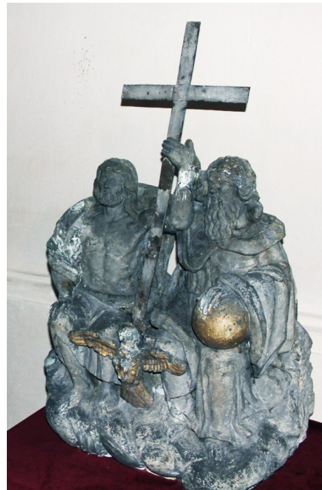
Pôvodné súsošie sa nachádza v kostole.